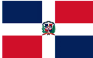
REPÚBLICA DOMINICANA (1)